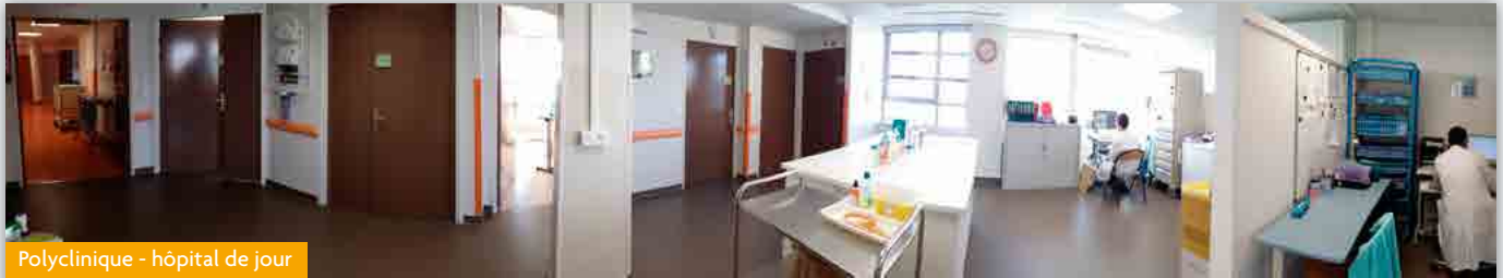
Polyclinique - hôpital de jour