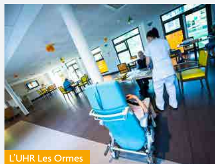
L'UHR Les Ormes