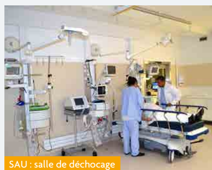
SAU : salle de déchocage