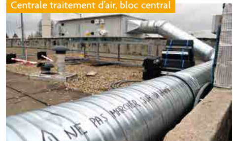
Centrale traitement d'air, bloc central

Les coûts associés, ainsi que les économies d'énergie réalisées ou prévues feront l'objet d'un prochain numéro.